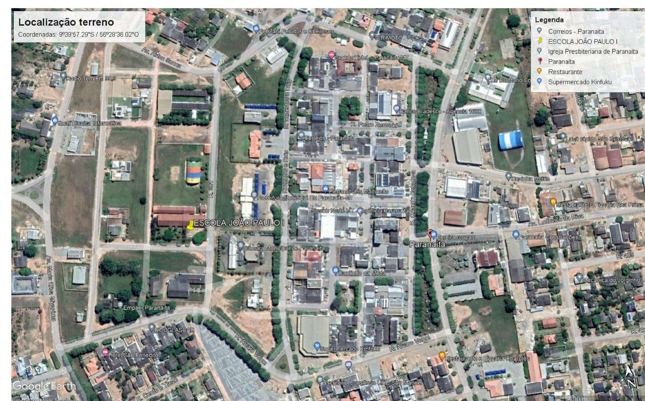
LOCALIZAÇÃO ESCOLA JOÃO PAULO (A SER DEMOLIDA)